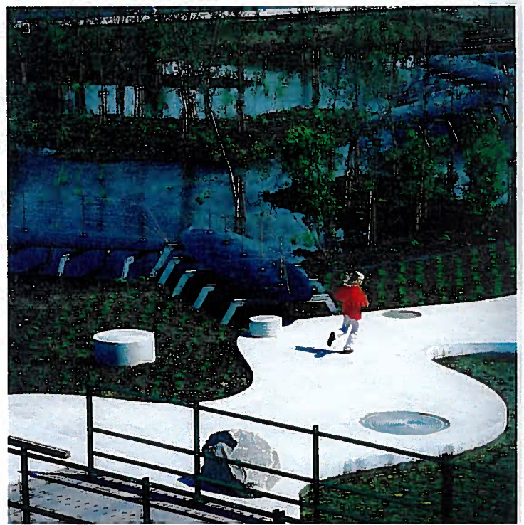
1: More give me more give me more, Martin Erik Andersen. 2: Plan til fortætning af Farum Midtpunkt, 1.præmie i konkurrence, arkitekter: Pernille Schyum Poulsen og Jan Albrechtsen. 3: Ankarparken, Malmø, arkitekt: Stig Lennart Andersson, foto: Jens M. Lindhe.