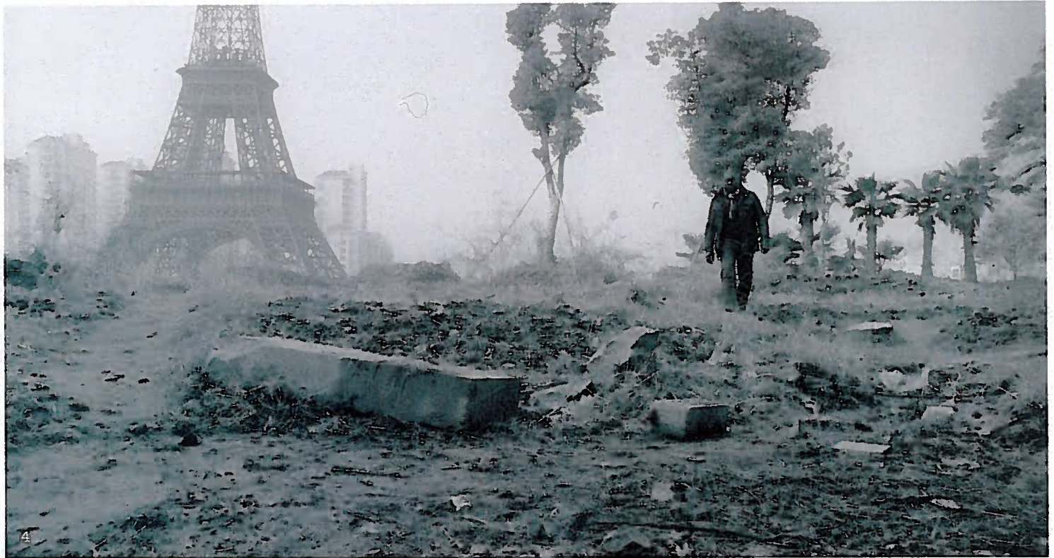
4: Intercourses, video, Jesper Just. 5: Værk af Finn Naur Petersen. Fotos ©kunstnerne.