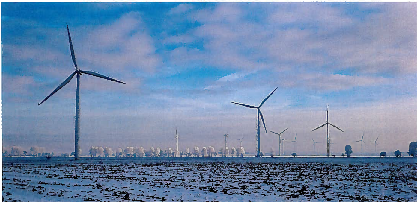
I Nordvestsjælland formidler en smuk frostdag den kaotiske opstilling af forskellige generationer af møller.

skala og lyd-mæssige påvirkning. Kraft-varmeverker er her et eksempel på, hvor vindmøllerne kunne indtage en plads side om side med de øvrige markante energiproducerende enheder.